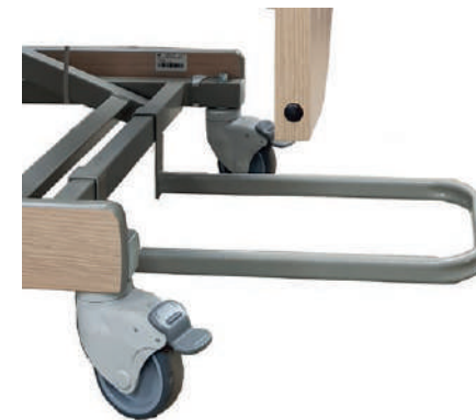
BUTÉE MURALE DE SÉRIE