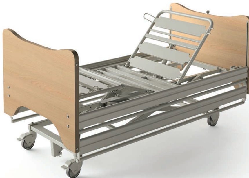
Barrières bois pleines longueurs de série

Matelas mousse simple ou matelas ALOVA mousse viscoélastique de prévention d'escarre