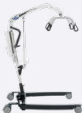
Birdie EVO COMPACT

La gamme des lève-personnes mobiles. Conçue pour les patients et les aidants.