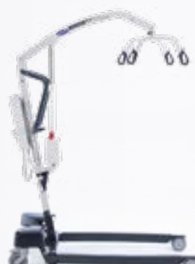
Birdie EVO XPLUS

Une version évoluée du Birdie, leader sur le marché des lève-personnes mobiles, conçu pour réaliser des transferts sûrs à la fois au domicile et également en collectivité.